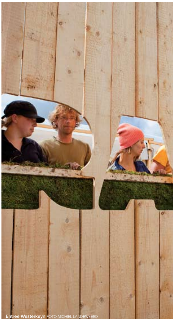
Entree Westerkeyn